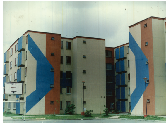
Edificios en construcción de la urbanización Ciudad Favidí, programa de vivienda ubicado en la localidad de Kennedy. Fondo de Ahorro y Vivienda Distrital. Archivo de Bogotá. Ciudad FAVIDI. 603.01.01.01.02.24.

memoria gráfica de los programas de vivienda y de los estudios sobre algunos planes que fueron realizados en diferentes zonas de la ciudad; estas corresponden a casas, apartamentos y lotes con servicios de algunas de las urbanizaciones que fueron proyectadas por el Fondo desde 1979, como: Parque los Urapanes, Recinto de San Francisco, Portal de J. Vargas, Santana Canapro, Parque Real, Providencia Alta, Moravia II, Quintas del sur, Villa Andrea II, El Carmelo, Puerta del sol I y II, La Toscana, Cataluña, Nueva Estancia, Tibabuyes, Bosques de Castilla, Villa Galante, Ciudad Favidí, Bosques de Granada, Galicia, Molinos II, Techo, Candelaria I, II, III, IV y V y Nueva Costa Rica. Otras fotografías pertenecen al estudio de factibilidad de la urbanización Parques del Zipa, a los estudios para el reordenamiento urbano de las zonas de San Victorino y Nueva