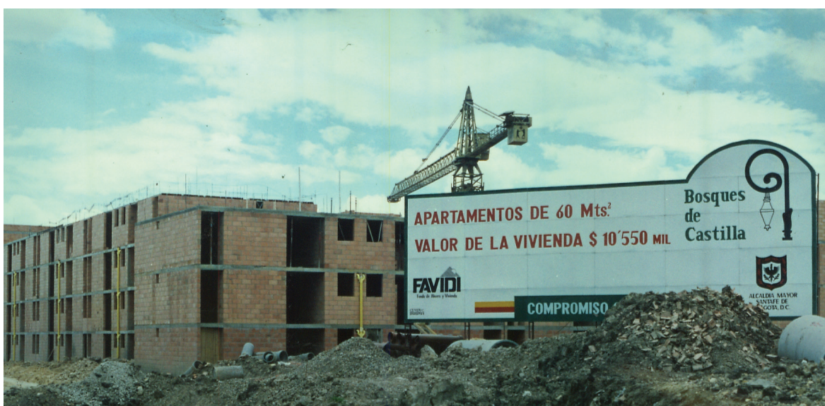
Apartamentos en construcción de la urbanización Bosques de Castilla, proyecto residencial de cuatrocientos cincuenta apartamentos entregados entre diciembre de 1993 y junio de 1994.

La otra parte de la documentación textual reúne información sobre la gestión administrativa del Fondo de Ahorro y vivienda en la implementación de mecanismos para facilitar el acceso a la vivienda, como son los trámites de cesantías, créditos hipotecarios y recaudo de cartera.